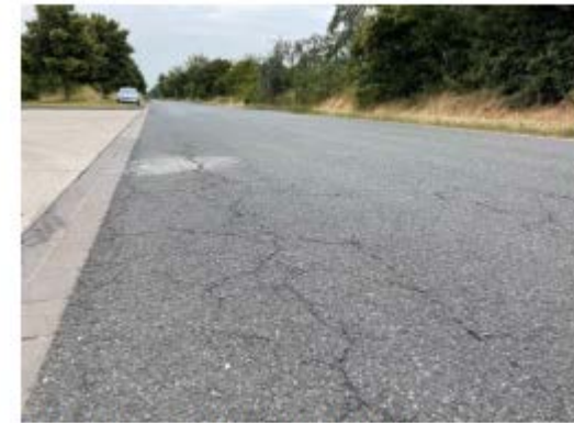
Abb. 3 Risse mit Rissverästelungen