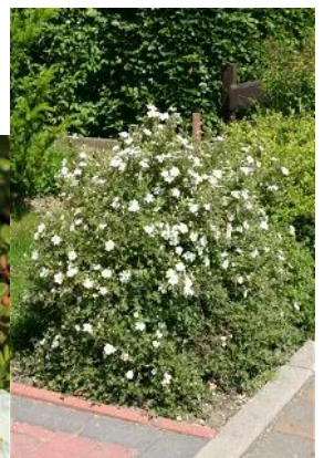
Fingerstrauch 'Abbotswood'/ botanisch: Potentilla fruticosa 'Abbotswood'